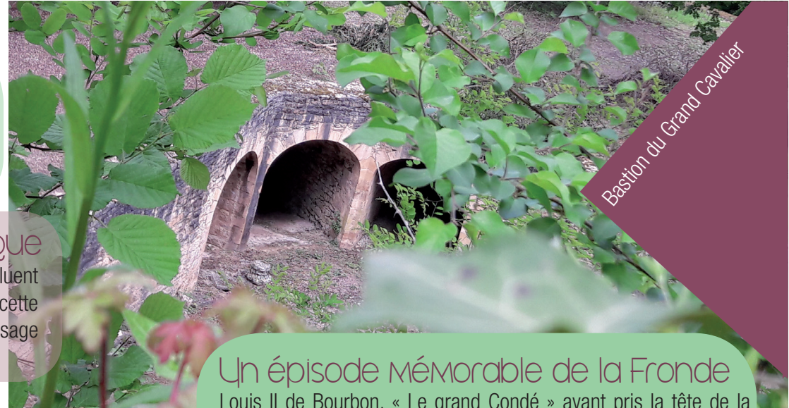
Bastion du Grand Cavalier