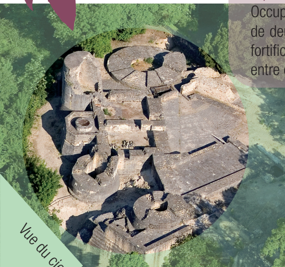
Vue du ciel

Venez découvrir et visiter cette forteresse qui vous séduira